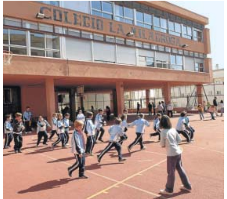
El colegio La Milagrosa ofreció diversas actividades.

Fue un día inolvidable también para los alumnos de cuarto y quinto ya que tuvieron doble motivo de celebración: una feliz jornada de convivencia y la confirmación de que podrán viajar a Roma y Florencia. ¡Menuda suerte! Y es que cuando todo se organiza con ilusión y ganas, como lo hicieron ayer los integrantes de este colegio, cualquier objetivo es posible.