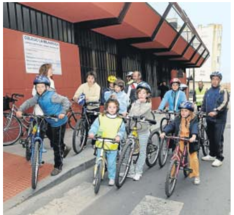
Alumnos y padres se animaron a una marcha cicloturista por el Puente Romano.